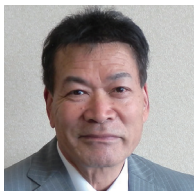
㊦ 原北 松本 三雄 ● 松新