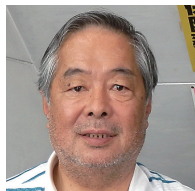
㊦ 一本松・桃里・植田 小池 高秋 ● 小池薬局