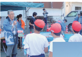
タカアシガニの講話中

当日は、タカアシガニに関する講話、カニへのタグ付け、計測のあとに、船に乗り込んでいよいよ放流。今年は百三十五匹のカニを放流しました。